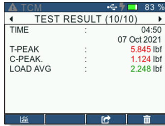
Saved results on the internal 32 GB SD card can be viewed and exported.