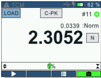
Live result screen with run number, pass/fail indicator, units, and display mode.